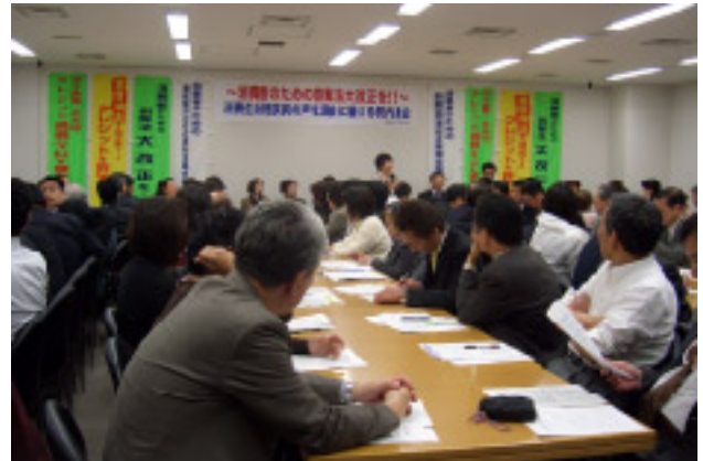
会場の第1会議室は参加者で熱い思いに包まれた

態をしっかりと把握し、来年の通常国会に改正案が上程され、法案審議してもらうときに役立ててもらうことにあり、院内集会での相談員の訴えはしっかりと届いたと言える。