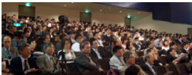
422名が参加し、熱気に包まれた会場

「クレジット会社自らの責任を負わせるために！」をスロ・ガンにした集会には、労福協、法曹界（弁護士、司法書士）、消費者団体、超党派の国会議員など幅広い団体や個人が参加。悪質商法被害にあった2人の方の訴えや消費生活相談員の現場からの被害実態の報告に会場は大きな怒りに包まれた。