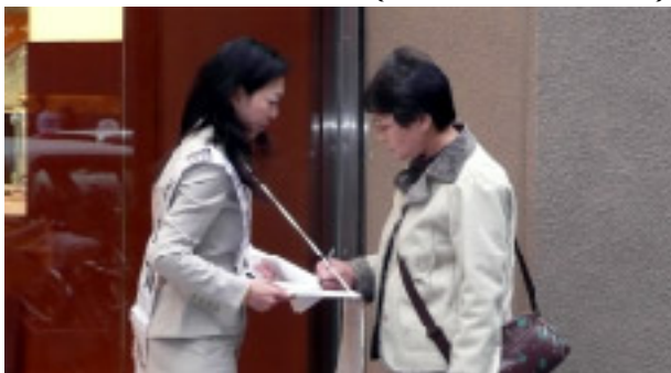
12筆の署名を集め、活躍した宣伝隊