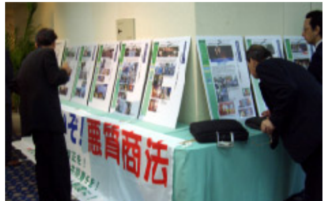
ロビーに展示された街頭宣伝報告のパネル

なお、幹事会が開かれた会場前には、労福協が9月に都内で実施した割賦販売法の改正を求める連続街頭宣伝行動の様子を紹介したパネル1枚が展示され、多くの出席者が見入っていた。