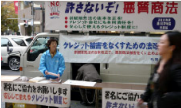
割賦法改正を訴える北海道労福協の仲間

北海道労福協は安心して使えるクレジット制度確立に向けた実効ある割賦販売法改正を北海道民に訴える街頭宣伝行動を10月29日12時より札幌市中心街で行った。