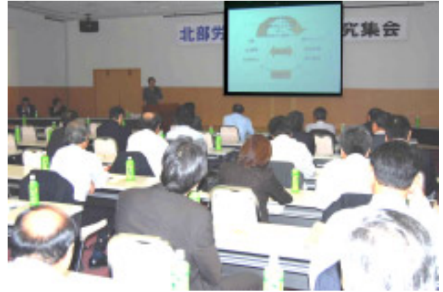
75人の参加者を集めた北部労福協研究集会