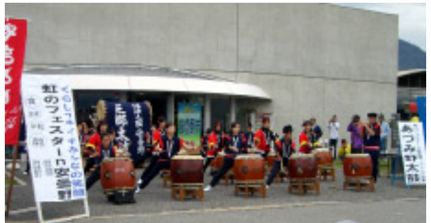
オープニングセレモニーでの安曇野太鼓

フェスタのテーマは「健康・食・環境・平和」で会場には約3,000人の県民が訪れ、基礎健康チェックや体力チェック、エコクッキングなどに挑戦するなど、自身の健康状態や食の安全について食育や環境問題に理解を深めていました。