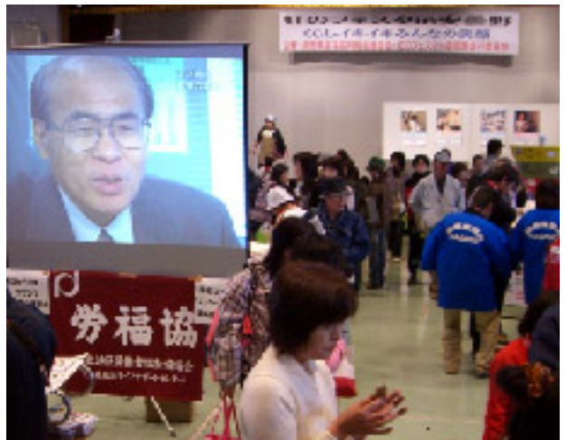
虹のフェスタ in 安曇野に出展した長野県労福協