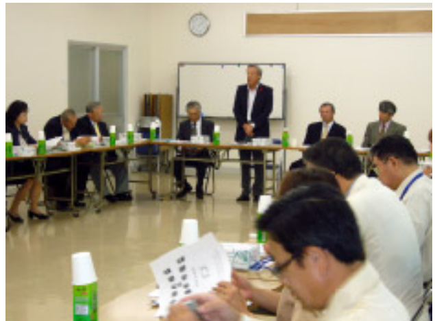
挨拶する千田中部ブロック会長と参加者