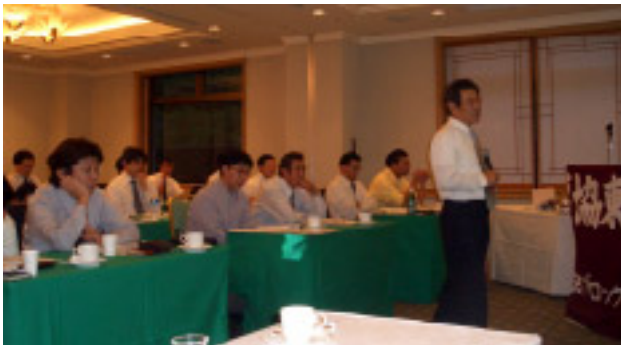
高木名誉教授と熱心に受講する参加者

後半では、「成熟社会・エイジレス時代の労働者福祉運動の課題と方向性、その中でリーダーの役割」と題し、日本女子大学の高木郁朗名誉教授が講演した。高木教授は、自主福祉運動に対し、90年代以降にどのような変化がおき、この変化が今後どのように展開するか、3つのソーシャルへの課題、求められるリーダー像などについて講義があった。