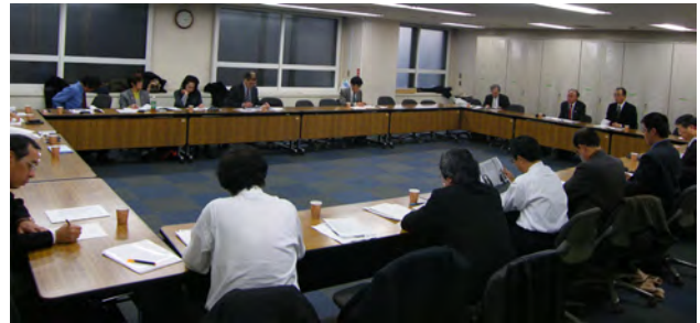
再開した「クレ・サラの金利問題を考える連絡会議」（1月19日、東京・総評会館）

3月7日には、「改正貸金業法完全施行を求める集会」（開催概要は左下）を開催する。