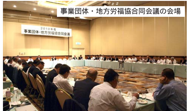
事業団体・地方労福協合同会議の会場

2日目（8日）は、「社会的企業としての労働者自主福祉事業」～「新しい公共」への展望～と題して、山口福祉文化大学教授 高木郁郎氏から講演があった。高木教授からは特に、新しい公共の定義として、政府部門が出来ない分野を担う分野