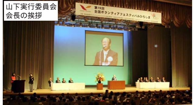
山下実行委員会 会長の挨拶

テル学院大学学長)が担当し、双方の団体の活動をDVDを交えながら紹介し、市民力・地域力を「おこす」「つなぐ」「伝える」ことが重要だと訴えた。翌日は22の分科会が開かれ、それぞれのテーマに基づき解決に向けた協議・研修が行われ閉会した。来年は、東京都で開催される予定になっている。