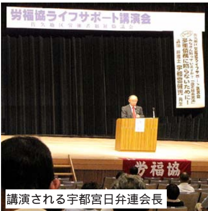
講演される宇都宮日弁連会長

の機会が欲しい。学校教育での金融経済教育強化の必要性を訴え、また来場者に自身の周りにも多重債務の問題を抱えている人がいたら、力になってやってほしいとよびかけた。