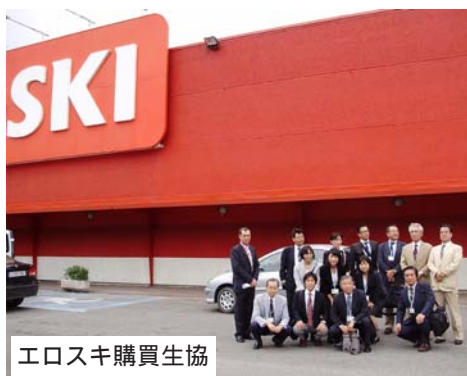
エロスキ購買生協