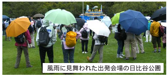
風雨に見舞われた出発会場の日比谷公園

実際の大地震では今回のような悪天候に加え、ビルや橋の崩壊など、さらに厳しくなるが、震災の意識づけとしては有意義な訓練であった。