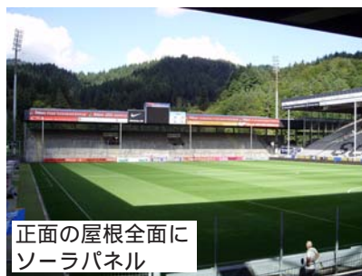
正面の屋根全面にソーラパネル

作物がある一定の価格以下にならないように加盟各国がCAPで定められた枠内で一次産品(米、砂糖、ミルク、穀物類)を買い上げている。PEADは、こうして買い上げた農