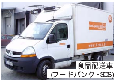
食品配送車(フードバンク・SOS)

ている。費用は各国政府の負担となる。ポーランドのフードバンクは、国内に30ヶ所(団体)あるが連盟に加盟しているのは27団体。連盟の役割は、主なメーカーと交渉し、食品を確保し加盟のFBへ割り振る。外国のメーカーからも食品を確保する事もある。2009年は1,200トン確保。食料品をもらい受けるだけでなくメーカーの為に、政府に対し様々な提案を行っている。連盟のロビー活動の成果として2009年1月より、食品製造企業の食品寄付にかかる「付加価値税2%(日本は消費税)」が免除されるようになった。詳細は、報告書に記載される。