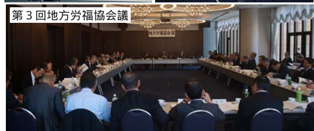
第3回地方労福協会議