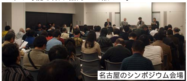
名古屋のシンポジウム会場

フードバンクに協力する企業は、CSRの観点からも増加しているが、食の安定供給にまでは届かないのが現状だ。各企業や事業団体に保管している「災害備蓄食料品」等も、入れ替え時期を少し早め可能な限り協力して欲しい。