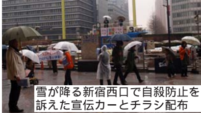
雪が降る新宿西口で自殺防止を訴えた宣伝カーとチラシ配布

街宣は、まず最初に挨拶に立ったライフリンクの清水康彦代表(内閣参与)は、自殺を社会問題の縮図