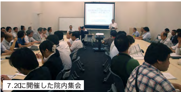
7.20に開催した院内集会