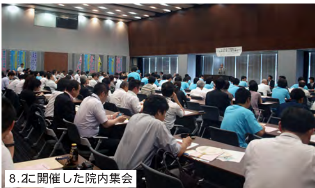
8.2に開催した院内集会

この事態を受けて、8月2日、日弁連と市民連絡会、ビギナーズ・ネットは緊急の院内集会を開催。司法修習の意義やフォーラム論議の問題点について訴えた。集会には各党の国会議員47名（本人16名、代理3名）が集まり、「党のプロジェクトで司法改革の光と影を検証していくが、給費制は不可欠だ」（民主党・辻憲法務部門会議座長）、「フォーラムにまかせず、各党が集まりフォーラ