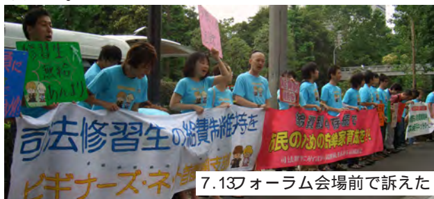
7.13フォーラム会場前で訴えた

市民連絡会は7月14日、こうしたフォーラムの議論の進め方について「とうてい容認できるものではなく、『金のかかりすぎる法曹の道』の改革・改善を目指して、日弁連やビギナーズ・ネットとともにさらに運動を強化していく」との声明を発表した。