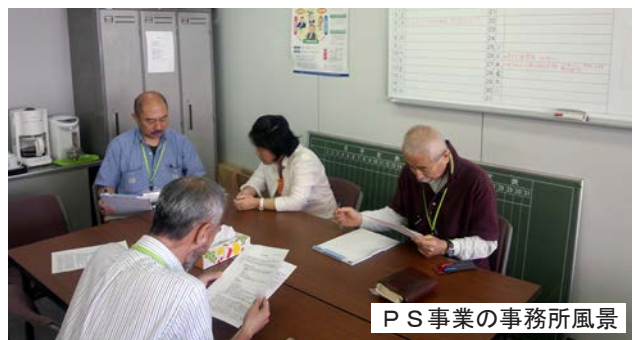
P S事業の事務所風景

引き続き、県内では、新潟・長岡・上越市の3カ所を拠点に事業を推進していくこととしているが、これまでP S事業において支援と協力をいただいた関係機関・団体、専門家の方々から参加いただき、この間の経過説明とさらなる連携強化を目的に、7月1日に「新潟県生活困窮者支援モデル事業連絡会」の開催を予定している。