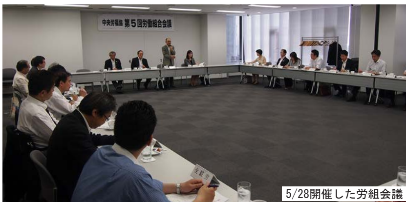
5/28開催した労組会議

また、女性出席者から、女性の声が反映されるよう何らかのポジティブアクションの検討をとの提起があり、提起を受けとめて対応していくこととした。