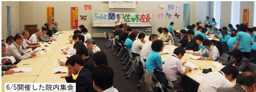
6/5開催した院内集会

法曹養成制度検討会議は6月26日に取りまとめを行い、今後は与党内での調整も踏まえ、本年8月2日までに法曹養成制度関係閣僚会議において結論を得る予定になっている。