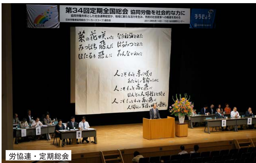
労協連・定期総会