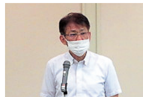
盛岡年金事務所 館川室長