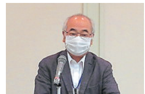
国民年金基金 鳥居支部長