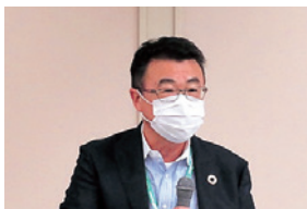
こくみん共済 coop 大瀧講師