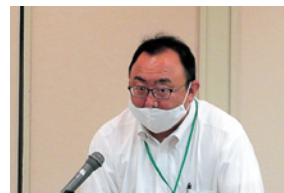
信用生協 船ヶ澤専務理事