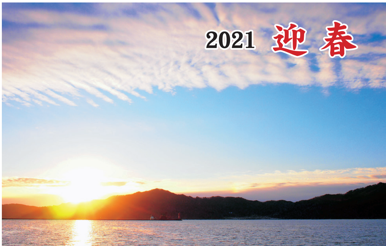
ひょうたん島 (大槌町)