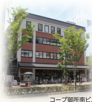
コープ御所南ビル