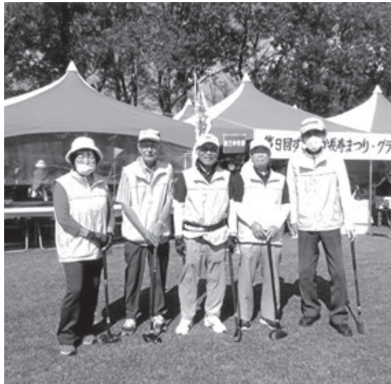
「G・G木曜クラブ」メンバー

鹿兒島支店友の会の「G・G木曜クラブ」では毎週2回、会員同志で楽しく練習をして、地域の仲間との交流にも積極的に参加しています。そんな中、9月29日〜10月1日に「鹿兒島市第9回すこやか長寿まつりG・G大会」が、約242チーム1,210名の参加の下、盛大に開催されました。