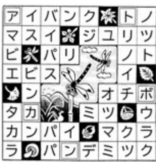
答え 「アカトンボ(赤とんぼ)」