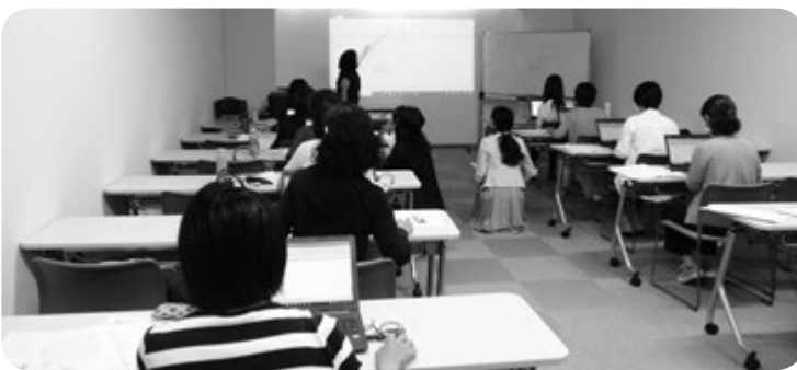
鹿児島会場 学習風景

鹿児島県労働者福祉協議会は、テルウエル西日本鹿児島営業支店の協力の下、10月3（土）・4（日）の両日、アエールプラザで開催しました。「パ