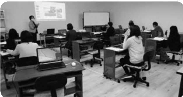
鹿屋会場 学習風景

今回は新型コロナウイルス感染防止対策を踏まえ、募集人員・運営等一定制限せざるを得ない中での開催となりましたが、参加者からは「分かりやすく良かった。楽しく勉強できた」等の声が寄せられ、今後も継続していきたいと思われました。