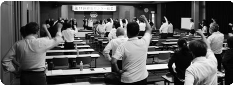
安心社会の実現へ一致団結

禍から脱却し、安心で持続可能な社会の実現への道筋を示すこと、そして連合が目指す「働くことを軸とする安心社会」の実現に向けて、働く者・生活者の立場にたった政治勢力の拡大をはかる重要な役割を担う、第49回衆議院議員選挙の意義を広く世論に訴える取り組みを強化していくなど、2021年度活動方針および予算を満場一致で決定し、総会は閉会しました。