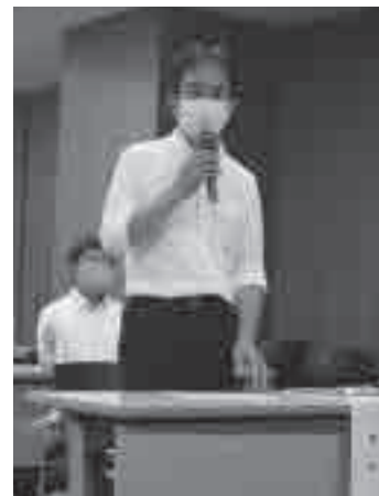
挨拶する守重議長

すべての働く人の幸せと豊かさをめざして、 連帯・協同で 安心・共生の福祉社会をつくろう!!