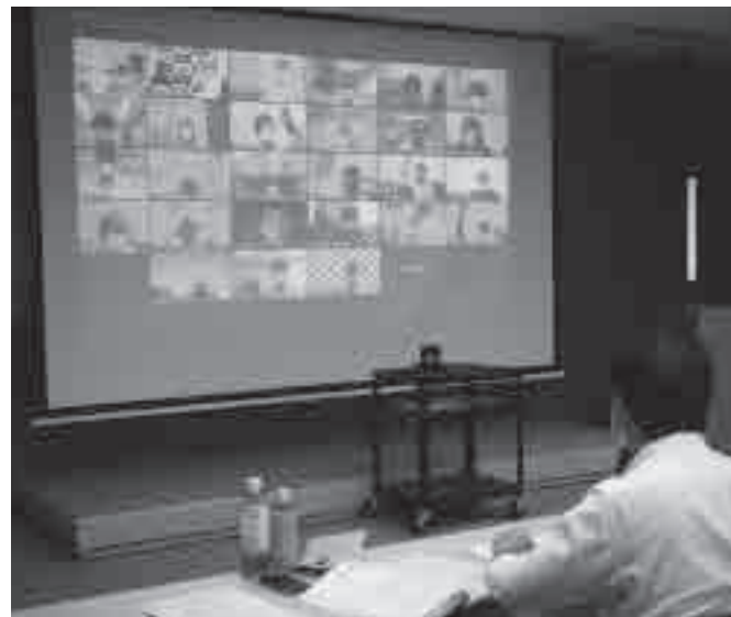
リモート参加の代議員

※例年定時社員総会終了後に実施していました、「協同組合大会」は新型コロナウイルス感染拡大防止のために2年連続で中止となりました。