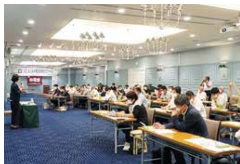
教育費・奨学金救済制度・ 多重債務に関して質問が ありました。