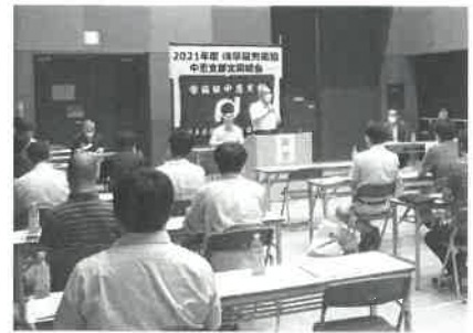
中恵支部会場の様子

今年度の各支部定期総会は、支部の判断により新型コロナウイルス感染拡大防止対策を講じたうえで、実開催とした支部と書面開催とした支部のいずれも、提案した議案はすべて可決されました。各支部ともに、2021年度活動方針・計画に沿って各労働福祉事業団体と連携し、連帯・共同でつくる安心・共生の福祉社会の実現に向けて取り組むことが確認されました。