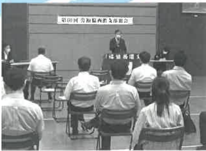
西濃支部会場の様子