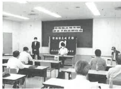
土岐支部会場の様子