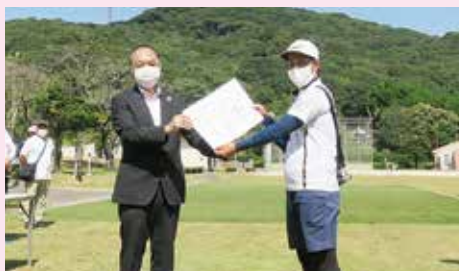
優勝！ 三菱重工労連香焼部