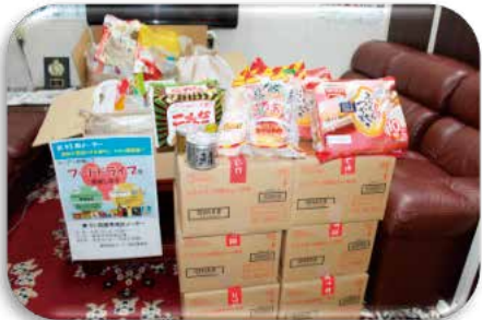
組合員から提供いただいた品々です。ありがとうございます。