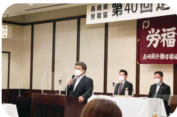
挨拶する高藤会長

人口減少、超高齢化社会、生活困窮、貧困と格差等々の社会課題に 向き合いつつ、各種の活動に取り組むことを確認！