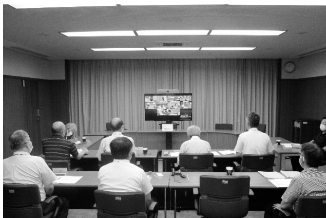
集合参加とリモート参加のハイブリッド開催