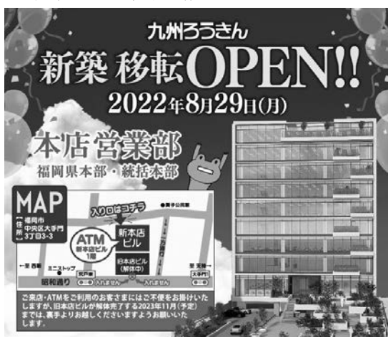
※図はグランドオープン後のイメージです

これを機会に、より一層親しみやすい福祉金融機関をめざしてまいりますので、これからも皆様のご愛顧を賜りますようお願い申し上げます。