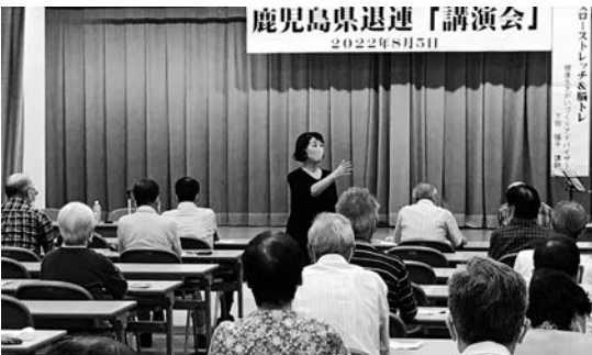
健康寿命を延ばそう