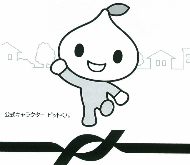
公式キャラクター ビットくん