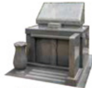
洋型グレー・青御影