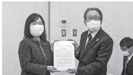
要請先：宮崎県（2023年1月18日）