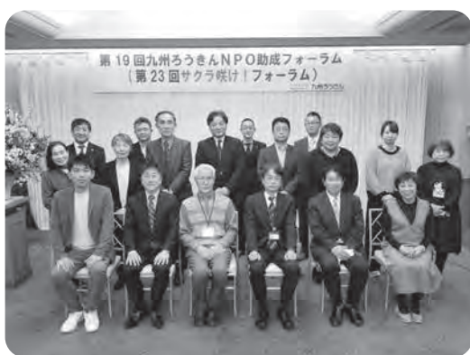
受賞団体と審査委員のみなさん

九州ろうきんは、今後も持続可能な共生社会の実現に向け、NPO助成や児童養護施設等への支援など、社会貢献活動に積極的に取り組んでまいります。