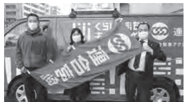
熊本へ引継ぎ（2023年1月30日）