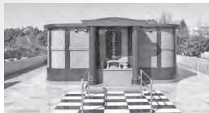
永代供養墓(合葬墓)

永代供養墓には、骨壺を安置する合葬墓と、粉骨したご遺骨を合祀し、供養する合祀堂があります。また、正面には、お参りのための香炉、花立て等が設置されています。側面には墓碑銘プレートを設置する銘碑が設けられています。