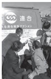
都城市にて鹿児島から引継ぎ（2023年1月25日）