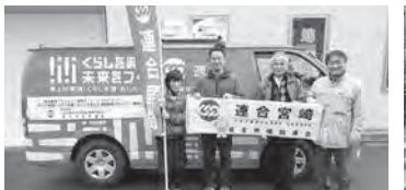
日向市、延岡市（2023年1月27日）