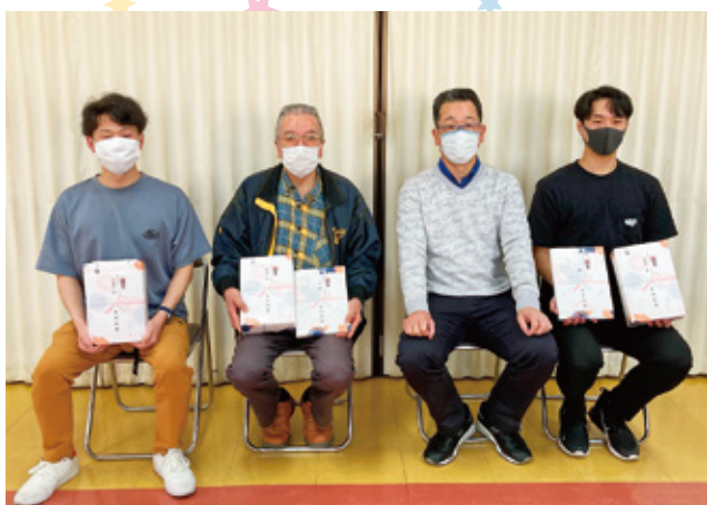
団体戦の部優勝 大分地区チームの皆さん