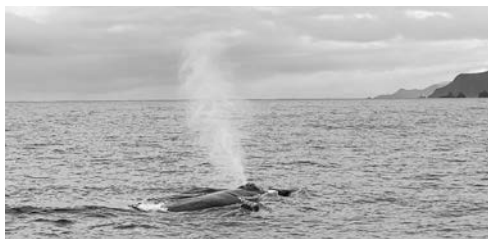
力強くブロウ(潮吹き)するクジラ

今回は、「フルークアップ(尾びれの腹側の模様を見せるしぐさ)」や「ブリーチング(空中で回転しながら海中へ落ちていく様子)」などの迫力ある動きを見ることができませんでしたが、毎年企画する予定なので、ぜひご応募ください。