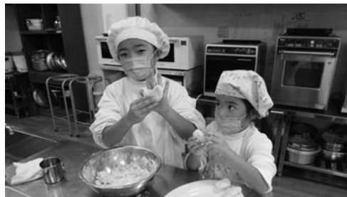
「いろんな形で作ったよ」

出来上がった鶏飯は全員で試食してあっという間に無くなり、もち天ぶらはお土産に持ち帰れるほどたくさん出来上がるほど、参加者にとって大満足の内容で、笑顔あふれる料理教室となりました。