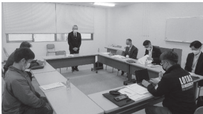
▲ 大隅地区会議の様子