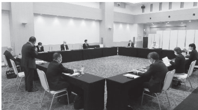
▲ 薩摩地区会議の様子