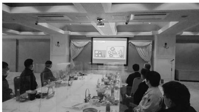
テーブルマナー講座

最後はマナーを気にしながら出された料理をおいしく味わい、満足そうな表情を浮かべていました。