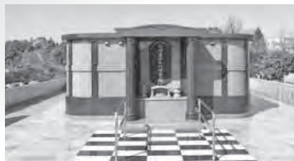
永代供養墓(合葬墓)

永代供養墓には、骨壺を安置する合葬墓と、粉骨したご遺骨を合祀し、供養する合祀堂があります。また、正面には、お参りのための香炉、花立て等が設置されています。側面には墓碑銘プレートを設置する銘碑が設けられています。