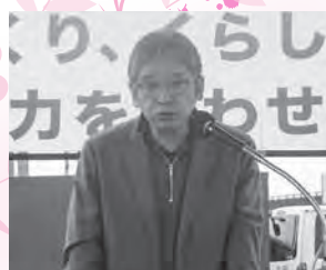
メーデー宣言 前原副会長