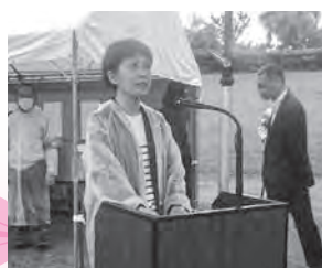
司会 重黒木事務局長