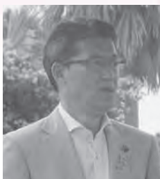
宮崎県知事 河野俊嗣 様