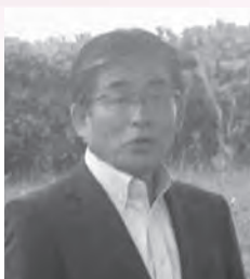
宮崎市副市長 永山英也 様