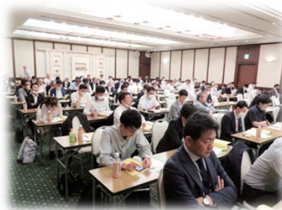
出席代議員は77名。役員を含めると100名を超え、久しぶりに会場は一杯に。

上五島からも役員・代議員が全員出席され、大変ありがたく思っている」と労福協の活動に対する日頃の奮闘と協力を含め敬意と謝意を表しました。そして、①我々の生活に大きく影響する2023春季生活闘争の継続した奮闘、②人口減少、高齢化の加速、深刻化する貧困