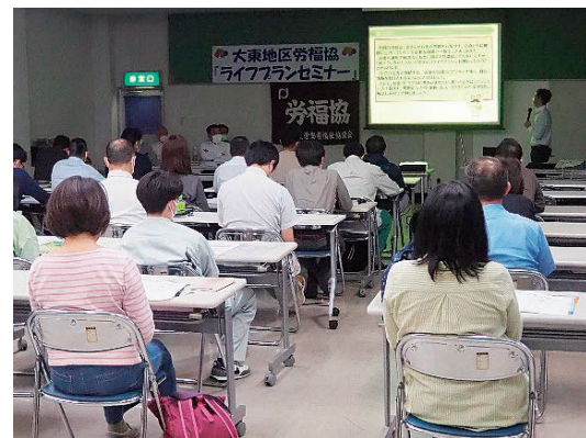
34名が「ローンの基礎知識」を学びました。

大村市と東彼杵の団体が組織する大東地区労福協は5月24日(水)18時30分より、大村市勤労者センター講堂において「ライフプランセミナー」を開催しました。今回のテーマは、「ローンの基礎知識」。九州ろうきん大村支店の大坪係長よりローン利用の際の注意事項を学びました。