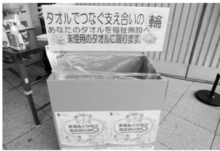
タオルをお願いします