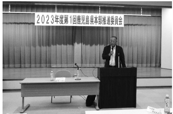
鎌田推進委員長の挨拶

会議では、①推進委員会の活動、②2023年3月末概況と取り組み結果、③2023年度計数計画達成に向けた取り組み、④九州ろうきんがめざす業務改革、⑤取引拡大の取り組み、⑥その他、について県本部推進委員ならびに県本部より提案、全議案とも満場一致で確認され、2023年度のスタートを切りました。