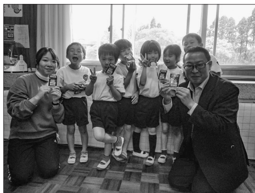
新1年生と担任の先生（志布志市立田之浦小学校）

志布志支店では、社会貢献活動の一環として、毎年管内の新1年生へ防犯に役立てて貰うためのグッズ(反射ホイッスル)を贈呈しています。今年度も志布志市・曾於市・大崎町内のすべての新1年生547名に贈呈しました。その中の志布志市立田之浦小学校では、新1年生全員へ「ツカエルさん反射ホイッスル」を直接贈呈することができました。