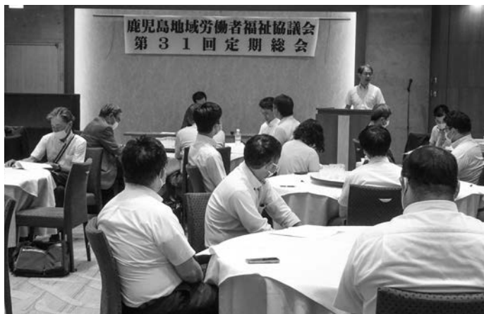
鹿児島地域労福協 第31回定期総会

定期総会では2022年度の活動報告および決算報告、2023年度活動方針(案)・予算(案)、役員改選など、すべての議案が可決・承認されました。今後は、鹿児島県補助事業(ライフプランセミナー・介護教室・歴史探訪講座など)、地域労福協活動支援事業(地域労福協の特性を生かした活動)などが計画・案内・実施される予定です。多くの皆様のご参加をお願い致します。