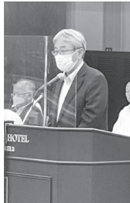
榮留本部長(理事長)