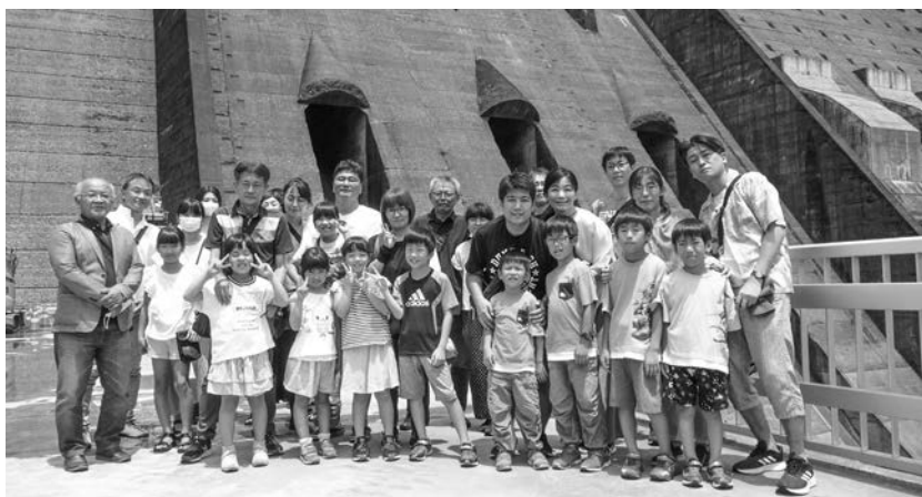
鶴田ダムで全員集合

鹿児島県労働者福祉協議会は、7月28日(金)・29日(土)の両日、北薩・いちき串木野の自然と歴史などを楽しみながら学習することを目的とした親子ふれあい講座を開催し、7家族・28人(大人17人・子ども11人)が参加しました。