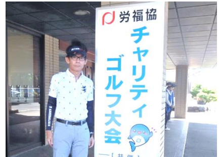
労福協マスコット『きょうちゃん』が入った看板へ一新しました。

2023年9月1日（金）灼熱の太陽の下、秋田カントリークラブにおいて110名が参加しチャリティゴルフ大会が開催された。この大会は生活困窮者支援やNPO・福祉団体等へ寄付をする目的で開催している。今大会では、7月に甚大な被害をもたらした秋田豪雨支援も予定している。大会の主旨に賛同頂いた労働組合・企業・労福協構成団体よりプログラム広告代「89件110万円」会場の募金箱には「104,744円」と多くの募金があった。集まったチャリティ金は例年同様、各福祉団体へ寄付する予定である。