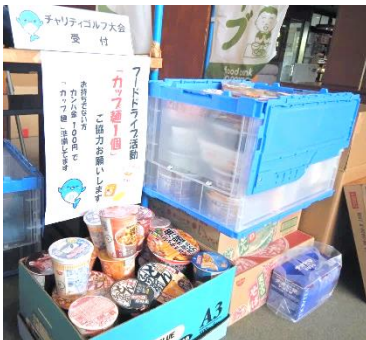
カップ麺を持参でない方は カンパに協力してくれた

チャリティゴルフ大会当日、受付にて「カップ麺1個寄贈運動」も実施。参加者全員の協力により147個14,840gのカップ麺・インスタント麺等が集まった。