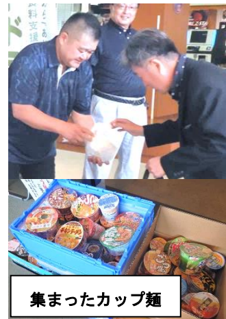
集まったカップ麺