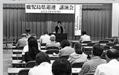
固定観念に縛られない自分の人生を

ジェンダー平等実現のためには意思決定の場への女性の参画、アイコンシャス・バイアス(無意識の思い込み)に気付き、意識して行動することが重要である。男女ともにジェンダーにとらわれず、自分の人生を選択できる社会をめざしていこうと訴えました。