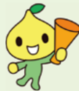
公式キャラクター ビットくん