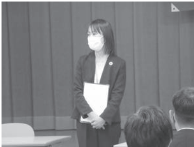
▲ こくみん共済 coop 鳥越職員

こくみん共済 coopとろうきんを一緒に学んでいただくことで、より一層、労働者自主福祉運動への理解がすすむことを期待しています。