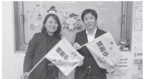
▼九州労働金庫 鹿児島県庁支店 出口次長（左）と事務局

自分の子供が通っている小学校では、通学路において危険な交差点などがあり、下校時に保護者が交通安全の取り組みを行っています。そのような場面でこの横断旗を活用することで、より安全に通学してほしいと思いました。また、今回の寄贈に自分が携わったことで、自分たちのマイカー共済の見積もりが、このような寄贈や社会貢献につながることも実感することができました。