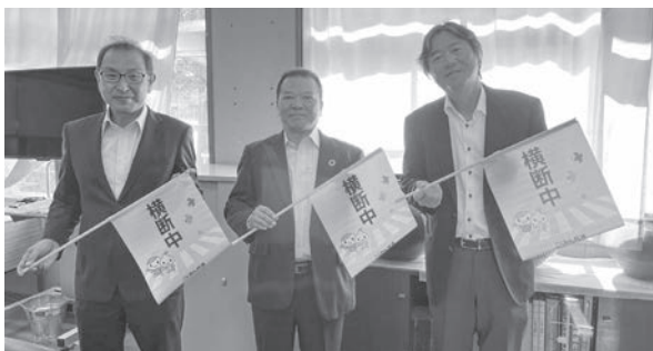
▲ 鹿児島市立西紫原小学校 寄贈式