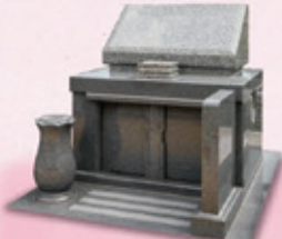
洋型グレー・青御影