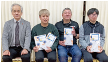
団体戦の部優勝 (中津地区・THKリズム労組)