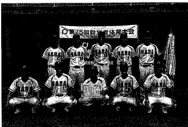
軟式野球 試合結果