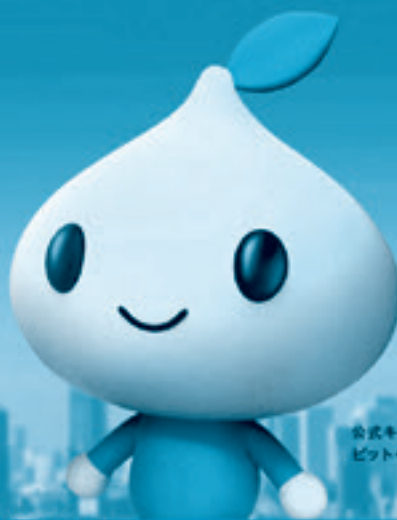
公式キャラクター ビットくん