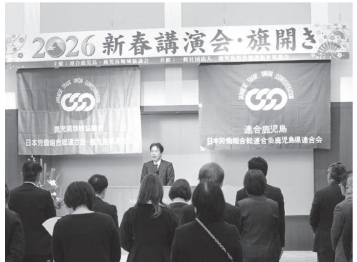
あいさつする連合鹿児島海蔵会長

講演会終了後に連合鹿児島・鹿児島地域協議会共催「2026旗開き」を開催し、海蔵会長のあいさつに始まり、来賓の鹿児島県知事、鹿児島市長、支援政党の代表よりご挨拶をいただきました。最後に中川路副会長のあいさつ後、海蔵会長による団結ガンパロウで締め括りました。