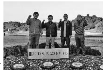
団体優勝の自治労出水市労連Aチーム