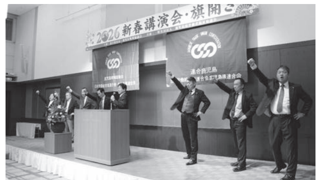
今年も団結してカンバロウ