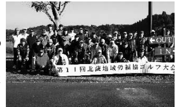
スタート前に記念撮影

チャリティーで実施したカンボジア教育支援募金は、ショートホールでワンオンしなかった場合に寄付するルールでしたが、ワンオンした人からも多くの善意が寄せられ、9,681円が集まりました。募金は県労福協を通じてカンボジアの教育支援に充てられます。