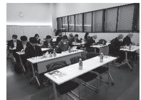
熱心に聴き入る参加者