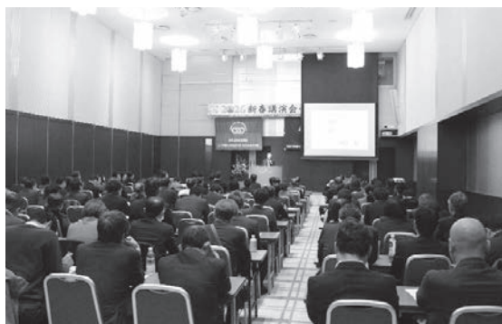
新春講演会の様子