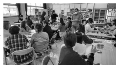
真剣に説明を聞く様子