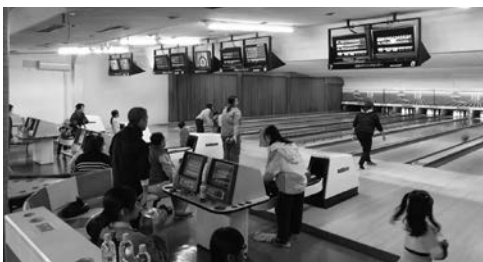
ボウリングを楽しむ参加者の様子