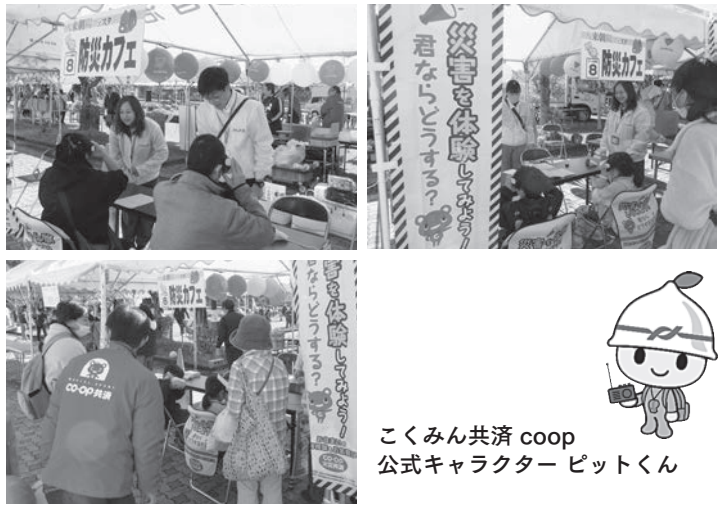
こくみん共済 coop 公式キャラクター ピットくん

これからもこくみん共済 coop として、防災・減災のための啓発活動を展開していきます。