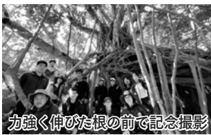
力強く伸びた根の前で記念撮影

林道から山道に入ると、野生のヤクザルやヤクジカに何度も遭遇するなど、自然と動物の共存を目の当たりにしました。炭窯の跡や生活の名残がある陶器などが確認できる集落跡にたどり着くまで身に着けた端末の記録によると、1.3kmの道のりを散策しました。雄大な屋久島の自然で、暮らしていた人々の営みや歴史に思いをはせる貴重な時間となりました。