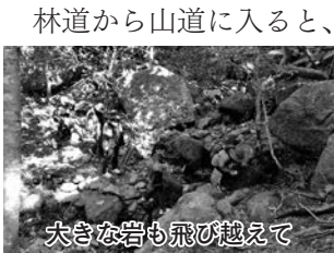
大きな岩も飛び越えて

西部林道は屋久島西岸にある栗生集落と永田集落を結ぶ約20kmの道路の通称で、世界自然遺産登録地域も含まれています。当日は林野労組屋久島森林管理署分会の協力の下、県保有区域への入山許可を得て散策しました。