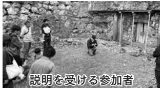
説明を受ける参加者