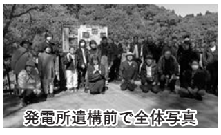
発電所遺構前で全体写真