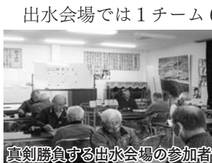
真剣勝負する出水会場の参加者

両会場とも9時に開会式を行い、ろうきんや労福協の取り組みを紹介後、対局を始めました。