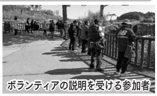
ボランティアの説明を受ける参加者