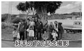
好天の下で記念撮影

沖永良部島古墓群については未解明の点も多くありますが、沖永良部の歴史について学べる有意義なツアーとなりました。