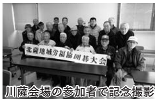
川薩会場の参加者で記念撮影

出水会場では1チーム6人で総当たり戦を行い、同順位者で決定戦を行いました。川薩地区では参加者の段位や級によって3パートに分かれて対戦し、3位まで決定しました。両地区とも昼食を取る時間を惜しむほどの熱戦が続き、終了後に表彰式を行いました。