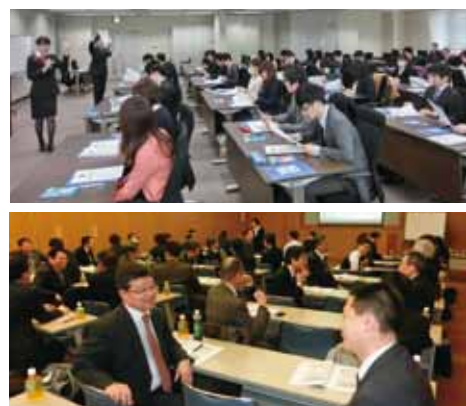
▲若年職員研修会(上)と幹部職員研修会の様子(下)