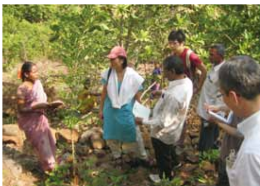
(右)国際協力の現場で学ぶ「NGOスタッフになりたい人」のためのコミュニケーションカレッジ(Nたま)海外研修。参加者の多くが加盟NGO50団体のいずれかで活躍するようになる。