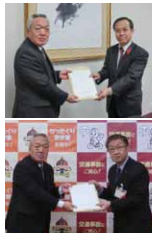
▲▲愛知県(上)と名古屋市へ(下)要請書の提出と意見交換(左)