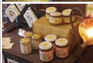
昭和初期のイメージで内装された南吉館の内部。壁面には安城高等女学校時代の南吉の珍しい写真が展示されて いる。右下は、安城名産のいちじくや、ナシから作ったジャムやいちじくの入ったごちそう。