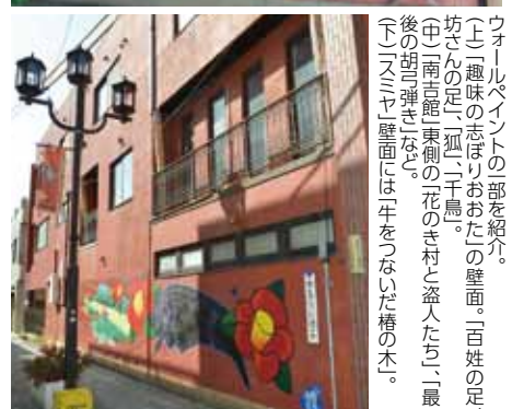
ウォールペイントの「部」を紹介。 (上) 趣味の志「おた」の壁面。「百姓の足、 坊さんの足、狐、二十鳥」。 (中) 「南吉館」東側の花のき村と盗人たち、「最 後の朗読会」など。 (下) 「スミヤ」壁面には牛をつないだ橋の木。