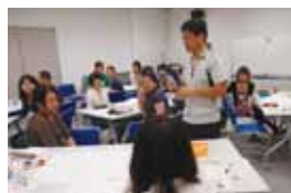
名古屋NGOセンターが実施する研修の一コマ。ワークショップを通じて皆でアイデア出しや意見交換を行っている。