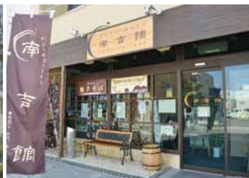
(上) 株式会社伊藤商店の筋向いにある「南吉館」。壁にはウォールペ イントが描かれている。また、幻の安城和牛の入ったごちカレーが評判。 (横) 展示コーナーでは、新美南吉直筆の俳句の色紙や、童話作品の初 版本、原稿(複写)などを見ることができる。