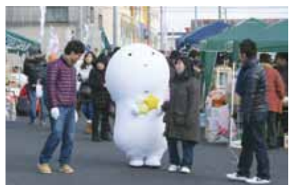
毎月第4土曜に開催される「きーぼー市場」に登場する「ゆるキャラ」「きーぼー」はすっかり市民の人気者。

来てこの会社を立ちあげました。でも、つい4年ほど前に『お前おもしろそうだから理事長やれ』と突然言われたんですよ。」