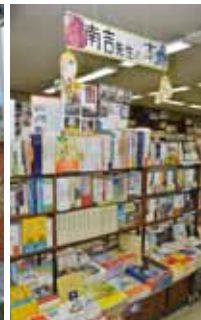
新美南吉の教え子だったおばあさんのいる「日新堂書店」。右の壁を良く見ると 新美南吉生誕百年のポスター(←左拡大図)が。また、店内の一角には「南吉先 生の本」だけを集めた特集コーナーも。