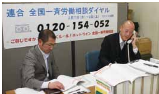
働く仲間からの相談を受ける労働相談ダイヤル担当者