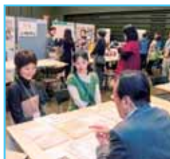
東海ろうきんのブースで熱心に支援の相談をされる団体も。