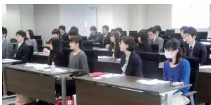
▶若年職員研修会(上)と 幹部職員研修会(下)の様子