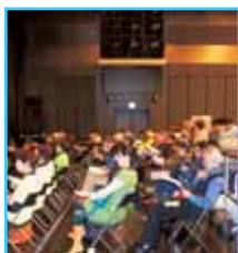
皆さん各グループ12分の発表に熱心に耳を傾けられていた。