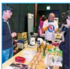
各ブースでの交流も活発に行われていた。