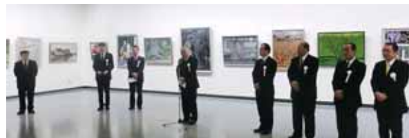
▲勤労者美術展表彰式の様子

また、1月26日には表彰式が行われ、各部門ごとの優秀作品に対し、愛知県知事賞・連合愛知賞・愛知労福協賞をはじめ、後援団体の東海労働金庫賞・全労済賞・住宅生協賞・労働協会賞などの各賞が贈呈されました。