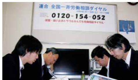
働く仲間からの相談を受ける労働相談ダイヤル担当者