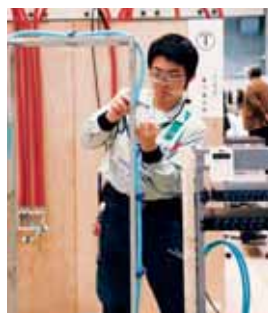
ニーズの高い「情報ネットワーク施工」はまるで配線のパズルだ。