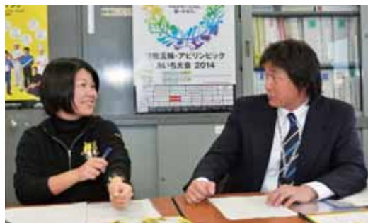
県と協会は密接な協力関係で愛知大会の成功を目指す。お二人の気さくなやりとりからは良好なチームワークを感じた。