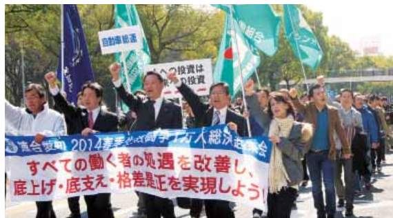
デモ行進「みんなで春闘 勝ち取るぞ!」

その後、青年委員会・女性委員会を先導役に、参加者全員で「月例賃金を引き上げるぞ!」「労働者保護ルール改悪反対!」など名古屋市内でデモ行進し、シュプレヒコールを行うとともに、栄メルサ前では街頭宣伝行動を行いました。