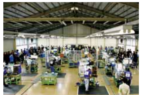
「スタジアム」の雰囲気のある機械組立て。大型設備・機器は学校や研修施設の設備更新に合わせて調達される。