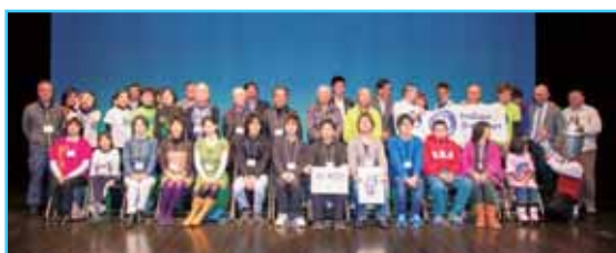
発表の方やブース出展の方からフェスタのスタッフの皆さんまで揃っての記念撮影。この輪が回を重ねるごとに広がることを祈って。