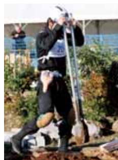
高校生の参加が増えてきた「造園」。