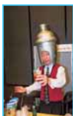
知る人ぞ知るシェーカーマン登場。