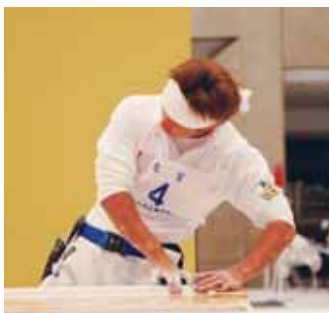
意外に繊細さが求められる「左官」の競技。最近ではアート感覚で取り組む若い人もいます。

●9月：「カウントダウンイベント」 機械系以外の職種で公開練習会。 （開催場所：オアシス21）