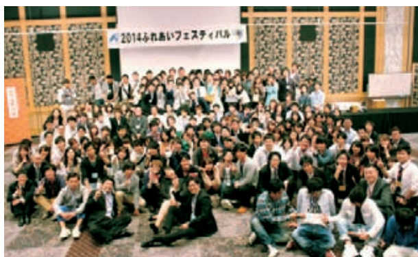
参加者全員でハイ、チーズ！

カップルビンゴ大会が行われ、会場は若年層組合員の熱い熱気で大いに盛り上がりしました。