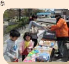
阿久比ふれあいの森