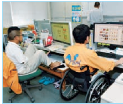
印刷課・デザインルームでのひとコマ。毎週全員で掃除 しているので、清潔そのもの。安全のためでもある。