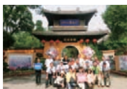
無錫市錫惠公園にて(団員20名)