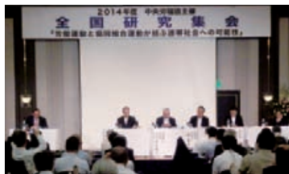
パネルディスカッション