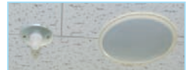
聴覚障がい者のための天井スピーカー横のランプ。