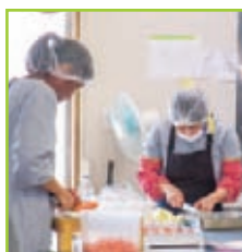
明日の食材の下ごしらえ。新鮮な野菜を大量に刻む。