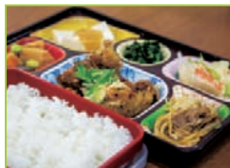
この日のお弁当は人気の唐揚げがメイン。ご飯は大盛り無料、玄米も選べて400円は嬉しい！