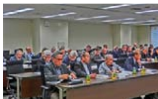
総会代議員のみなさん