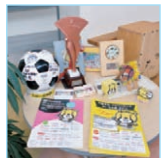
玄関ロビーにはチラシ類やアイチャータグズがいろいろ並び。