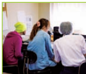
予約注文を集計したり、ムダのない配送ルートを割り出したりの仕事も毎日大変。