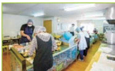
合理的に配置された調理スペースは働きやすそう。皆さんムダなくテキパキと作業をこなしていく。