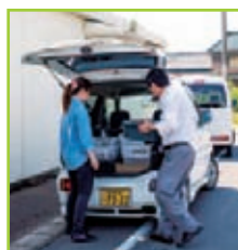
朝10時には出発。配送にはミニワゴン5台を使う。