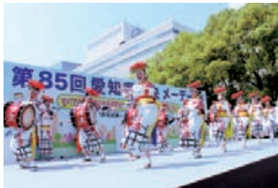
盛岡さんさ踊り清流のみなさん

開会に先立ち、東日本大震災被災地復興支援として、岩手県より「盛岡さんさ踊り清流」を招き、華々し