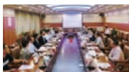
南京市江蘇省総工会表敬訪問

今回の訪中では、各地での食事やホテルにも恵まれ、全団員が快適に過ごすことができました。江蘇省総工会のご配慮と熱烈歓迎に心から感謝申し上げます。