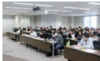
▲熱心に聴講する参加者のみなさん

な判りやすい説明を聴くことができ、今までの不明な点が理解できた事や参考になった事など、大多数の方がセミナーに参加して「よかった」と答えられました。