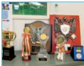
事務所には数々の大会での盾や賞状、トロフィーが並んでいる。