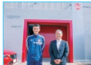
一宮・浅野の一角にある事務所は、鮮やかな赤の玄関が目印。