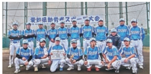
▲「優勝」豊田自動織機労組チーム