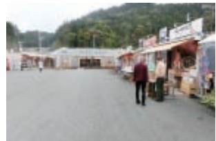
▲仮設の「さんさん商店街」