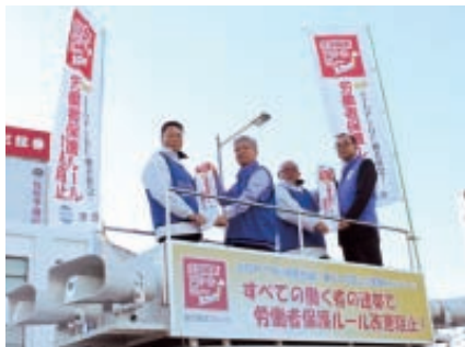
「タスキリレー」風景

連合は、政府が検討中の、派遣労働者受け入れ期間の上限廃止を柱にした労働者派遣法改正や、労働時間