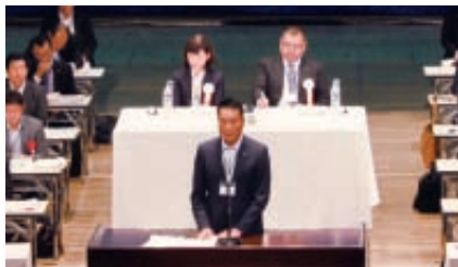
土肥会長あいさつ

多発し、これら災害により、犠牲になられた方々のご冥福を心からお祈りいたします。労働者保護ルールの改悪阻止の取り組みについては、私たちが強い信念を持って活動を続けなければ、労使関係のないところで働く人や非正規労働者に多大な影響を及ぼすことになる。9月25日から労働保護ルール改悪阻止を訴える全国縦断リレーをスタートさせ、連合愛知も11月24日に三重から運動を引き継ぎ25日～27日、岐阜に繋げるまで愛知県下で訴えていく行動を行うので、ぜひ、各構成組織・各地域協議会の積極的な参画をお願いしたい。