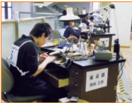
『貴金属装身具』競技の作業台の上のたくさんの道具は各選手が持ち込む。孤独な作業が1日半も続く過酷な競技だ。