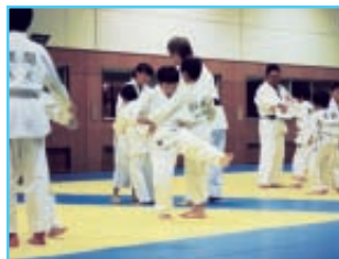
大きいお兄ちゃんが、小さな子たちの面を覗く姿は微笑ましい。