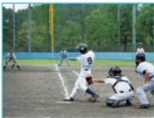
早くから甲子園が目標と小・中学生の硬式野球チームが増えている。