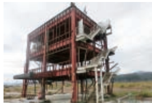
▲被害に遭った防災センター跡

参加されたみなさんは訪れることが復興応援だと認識していましたので、仮設商店街「さんさん商店街」での買い物にも積極的でした。