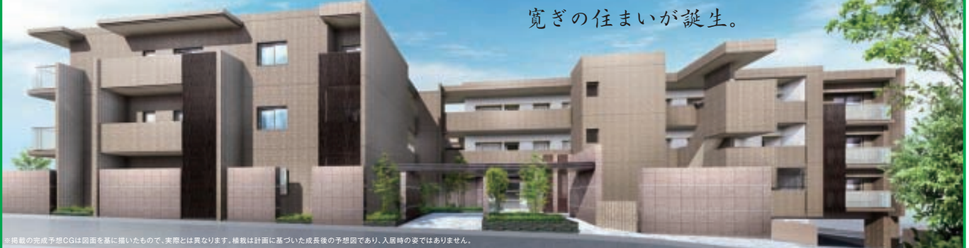
掲載の完成予想CGは図面に基いたもので、実際とは異なります。権数は計画に基づいた成長後の予想図であり、入居時の姿ではありません。