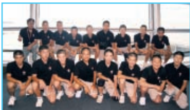
九州での西日本大会に参加した今年の愛知北リトルシニアの面々。将来のスター選手に期待したい。