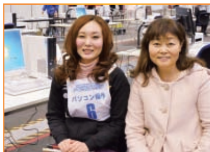
昨年は「努力賞」でしたが、今回は何か賞をとれそうな気がします。と競技終了直後の笑顔でお母さんと。