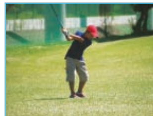
2016年リオ五輪ではゴルフも正式種目に。2020年の東京五輪が楽しみです。