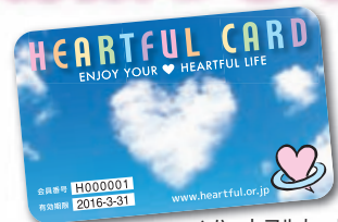
▲ハートフルカード