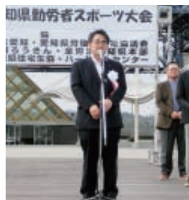
▲開会式:大村知事あいさつ