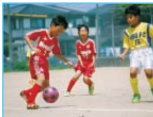
元気いっぱいボールを追う子どもたちの姿こそが、指導者のやりがい。