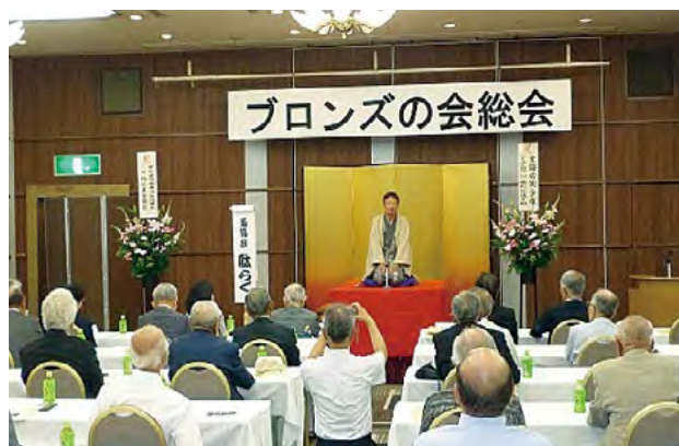
社会人落語家による落語