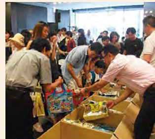
お子様への記念品はミニオンズ レッスンバッグとお菓子