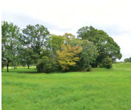
築造1500年後の姿のままの「東大久手古墳」。パンフレットにはまわりの芝生部分は「ランチエリア」と記されている。

「しだみゅー」では今「お庭に埴輪プロジェクト」を計画中。これは地域の住民に手づくりの埴輪を庭先に飾ってもらおうというもの。「しだみゅー」館内の窯などを使って家族やペットの埴輪など自由な発想で焼いてもらう。コンテストなども開催して定着していくうちに、お庭のツリーと競い合うような楽しいムーブメントになるかもしれない。そうなれば、きっと名実ともに「歴史の里 しだみ古墳群」のまちづくりに繋がることだろう。