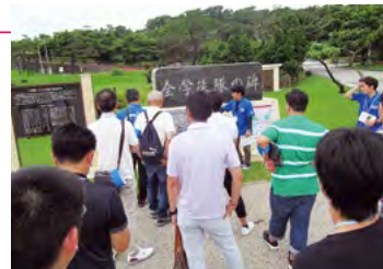
ピース・フィールドワークにて説明を受ける様子

2日目のピース・フィールドワークでは、連合沖縄青年委員会のガイドにより、糸数アブチラガマやひめゆりの塔など南部戦跡コースを巡り、沖縄戦の歴史と戦争の悲惨さ・愚かさを学びました。