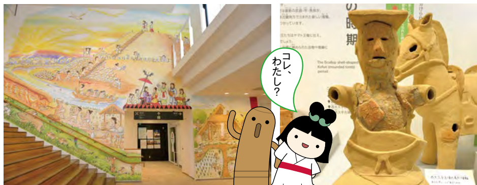
「しだみゅー」の1階ホールの壁いっぱいに描かれた古墳づくりの想像図。頂上では大王が自身の墓づくりを指揮している。