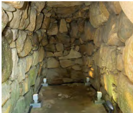
円墳「東谷山白鳥古墳」では名古屋で唯一完全な形の横穴式石室を見ることができる。

体感! SHIDAMU しだみ古墳群ミュージアム https://www.rekishinosato.city.nagoya.jp