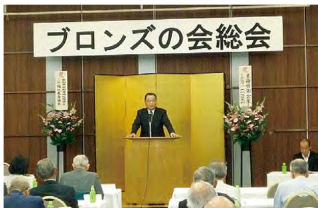
住田会長あいさつ

なお、総会の前段の記念イベントでは、社会人落語家2名をお招きし、楽しい落語を披露いただきました。