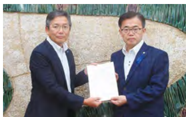
愛知県への要請行動

「2019-2020年 働くことを軸とする安心社会」の実現のための重点要望書を提出