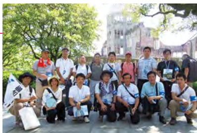
平和行動in広島へ参加したみなさん

続いて、核兵器廃絶1000万署名に向けてキックオフ！として、「2020年核兵器不拡散条約（NPT）再検討会議