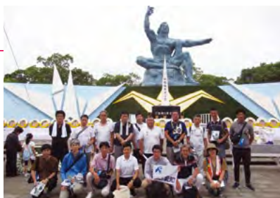
平和行動in長崎へ参加したみなさん

2日目の被爆74周年 長崎原爆犠牲者慰霊平和祈念式典では、長崎平和宣言(長崎市長)、平和への誓い(被爆者代