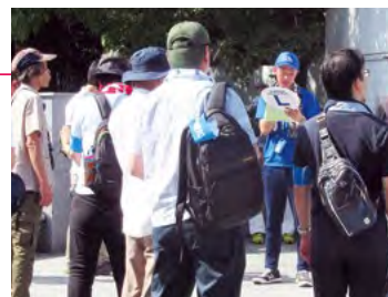
ピース・ウォーク参加の様子