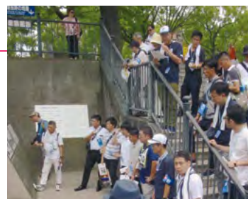
ピース・ウォーク参加の様子

表)が読み上げられ、核兵器のない世界と平和の実現に向けた取り組みの必要性を全体で確認しました。