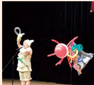
ミルキーちゃんの歌とパルーンショー