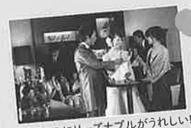
贅沢なのにリーズナブルがうれしい!