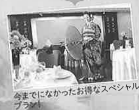
今までになかったお得なスペシャルプラン!

佐々木 希 sasaki nozomi COLLECTION presented by FANCY COLLEGE