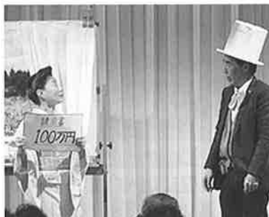
ひめネット笑劇団による 消費者トラブルの演劇(第2回)