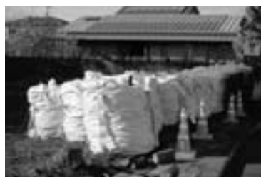
富岡町 夜の森 除染による廃棄物が野積み