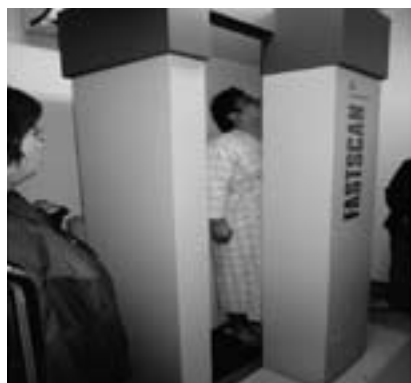
福島医療生協 WBCで内部被曝の検査

福島医療生協ではWBC（ホー ルボディーカウンター）という機器 を使って、内部被曝の検査を、浜通