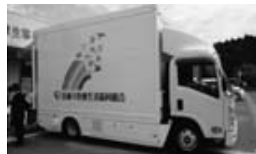
浜通り医療生協 FTF搭載車 各地に出向き検査