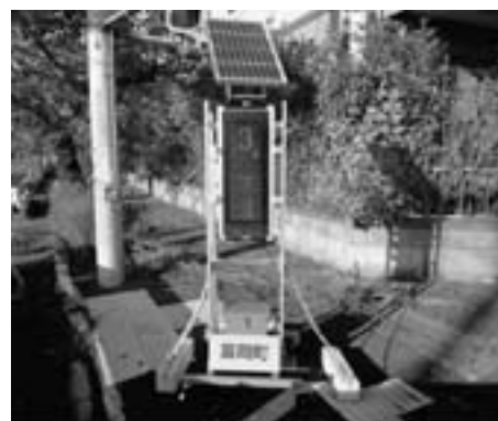
富岡町 夜の森 線量計 毎時3.73ミリマイクロシーベルトの表示が