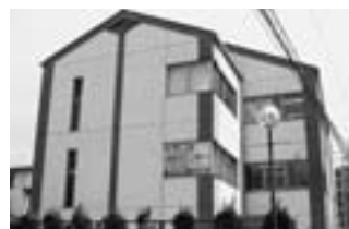
相談窓口は 労福協会館2F

ジョブえひめ就労支援センターでの相談状況は、4月～9月で284名の相談者があり、その内50名の方が新規相談者となっています。相談内容としては、「就労に関する相談」が171名で、「職業の紹介に関する相談」が