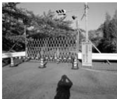
富岡町 夜の森 立ち入りを拒む 帰宅困難区域ゲート

今回の研修で、東日本大震災・原 発事故後の福島を目の当たりにし て、福島に住む人々の苦悩を知り、 震災がまだ終わっていないことをあ らためて感じました。震災の風化が 懸念されていますが、忘れることな く、とりわけ福島への思いをいつも 持ち続けたいと思います。