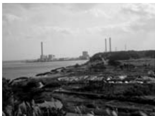
檜葉町 天神岬からの眺め 中央部一帯が廃棄物仮置き場