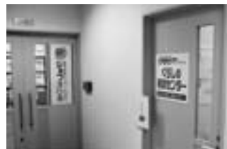
生活相談・就労 相談を併設して 対応