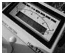
線量計 針が振り切っています