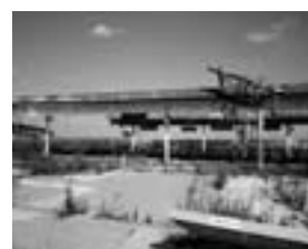
富岡町 JR富岡駅 震災当時のまま。復興が手つかず