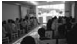
会館チャペルも皆さんに見ていただきました。