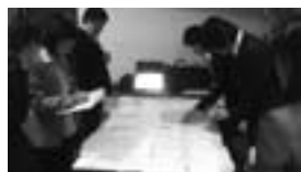
マッチング集計中。間違いがないよう確認を重ねます。