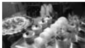
Laugh&Roughのスイーツをご用意