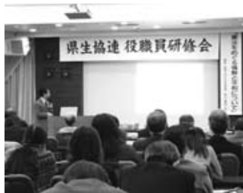
大学生協からは大学生も参加、熱心に聞き入っていました。