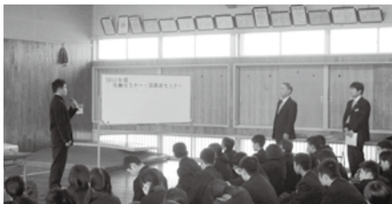
セミナー終了後の土居高校生徒代表者挨拶