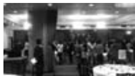
たくさんの方にご参加いただきました

マッチング結果は、14組のカップルが誕生。カップル誕生率について、結婚支援センタースタッフからも、「これまで実施してきたイベントの中でも、かなり高いカップル誕生率」との感想をいただきました。