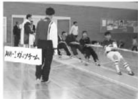
職域 第1位 A-W-I