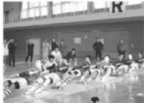
一般男子 第1位 鷹巣綱引クラブ