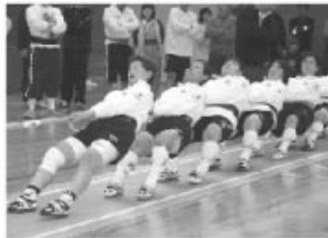
一般女子 第1位 スーパーレディーズ戦酔漢