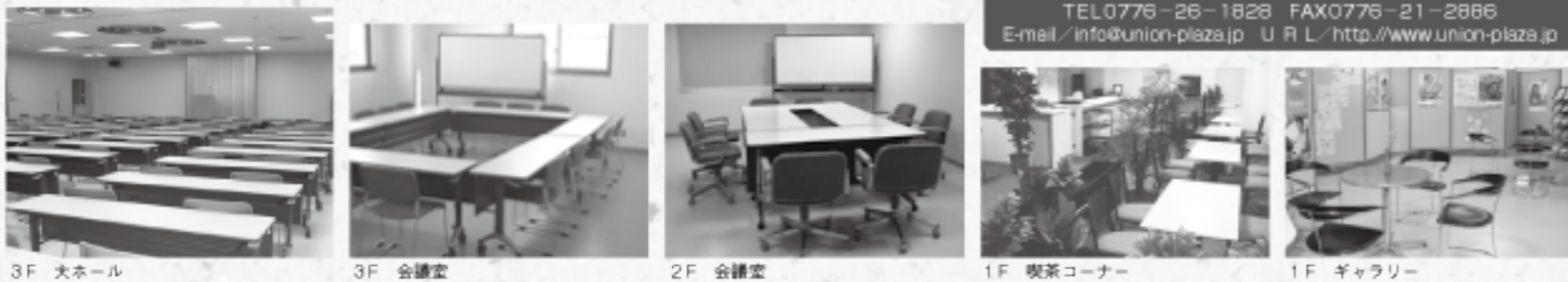
3F 大ホール 3F 会議室 2F 会議室 1F 喫茶コーナー 1F ギャラリー

会議室・ギャラリー・喫茶室をご利用いただけます。 (料金は会館事務局へご相談下さい)