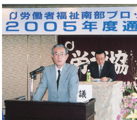
中武会長あいさつ