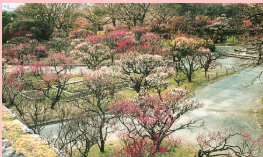
春はすぐそ 舞鶴公園