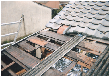
台風18号による被害の様子

現在(2005年2月22日)までの被災件数 全 国 69,969件 九州全県 28,401件 福岡県 7,010件 (うち自然災害 1,683件 )