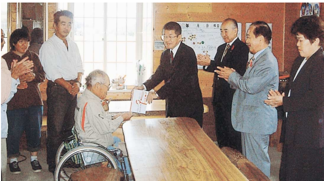
江藤議長 志摩町障害者共同作業所での贈呈式

2003年度「福祉募金」の取り組みは、県労福協が取り組み方針を決め、地域労福協を中心として取り組みを進めました。