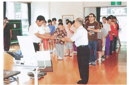
県労福協社会福祉施設寄贈物品贈呈式 (社)両筑福祉会 浮羽学園 '04.8.5

本年度も地域全体でばらつきもありましたが、約620万円の募金が集まりました。各地、数多くのカンパの取り組みもあり、改めて「福祉募金」のご協力にお礼申し上げます。今後地域労福協と打ち合わせ、本年度の物品贈呈を進めて参ります。又、本年にかぎり集約金の一部を「福岡県西方沖地震」に対する義援金として贈りたいと思います。