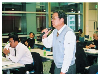
▲議案に対し代議員より質疑