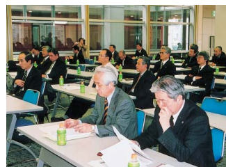
▲熱心に聞き入る代議員