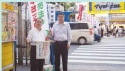
東京池袋東口で、割賦販売法改正の街宣行動 '07年9月20日(木) 17:30～19:00

今の割賦販売法では、詐欺的商法などで契約が無効・取り消しになっても、すでに払った代金は返してもらえません。おかしいですね。被害者を救済するためには、すでに払った代金についてもクレジット会社が販売をした加盟業者とともに共同して責任をとるようにすべきです。