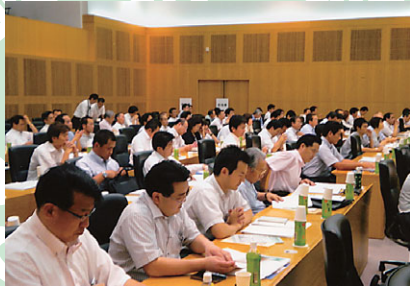
参加代議員の皆さん

まず、今月中旬から発生した、中国・九州北部豪雨についてであります。この豪雨で福岡県内はもちろんのこと西日本を中心に大きな被害をもたらしました。特に