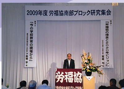
南部労福協高島会長挨拶

研究し共通認識に立つ立場として、今回は、人と人のつながりが大切にされる社会に向けた内容について学習を致しました。