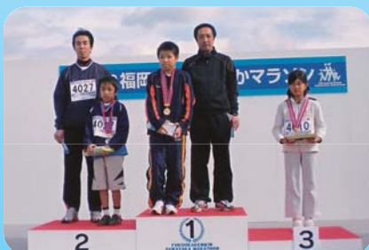
親子ペア部門 表彰式