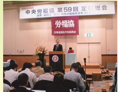
中央労福協 笹森会長 あいさつ