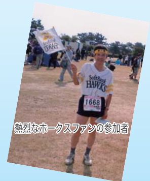
熱烈的ホークスファンの参加者