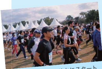
一般の部 男女さわやかにスタート