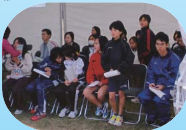
各種目で3位までの表彰待ちの皆さん