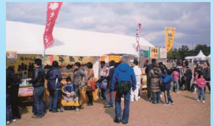
地元販売コーナー