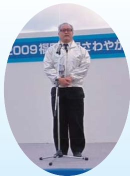
来賓あいさつ 高島県労協会長

2009年福岡県民さわやかマラソンは、11月15日(日)海の中道海浜公園特設コースで開催されました。