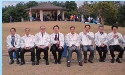
ご出席の来賓の皆様