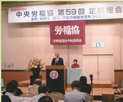
日本労働組合総連合会 古賀会長 来賓あいさつ