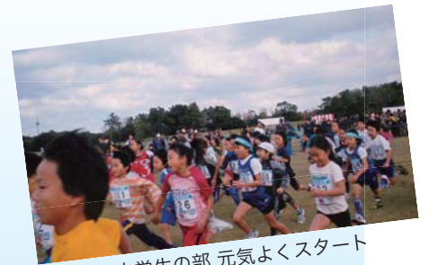
小学生の部 元気よくスタート

事故、トラブルもなく終了できましたのも各協力団体ならびに、陰でご支援いただきましたスタッフの皆さんのご協力の賜であり厚くお礼申し上げます。