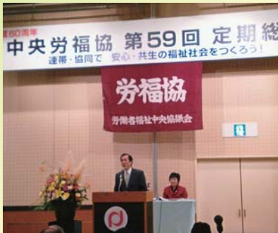
厚生労働省 金子労働基準局長 来賓あいさつ