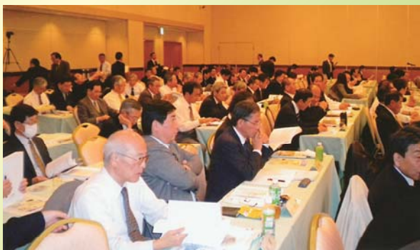
全国からの参加者のみなさん